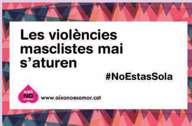
▲ Campanya 'Les violències masclistes mai s'aturen' de visibilització i prevenció de les violències sexuals.