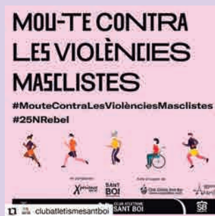
◀ Campanya 'Mou-te contra les violències masclistes', organitzada pel Club d'Atletisme de Sant Boi en col·laboració amb l'Ajuntament de Sant Boi de Llobregat.