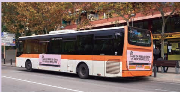
▲ Participació de tota la ciutat en la campanya 'Aquí ens rebel·lem contra les violències masclistes' fent visible el rebuig col·lectiu contra aquesta xacra social.